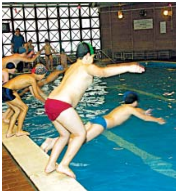
Fotónk korábban, tavaly szeptemberben készült