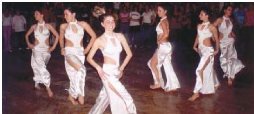
A bolgár jazzbalett csoport nagy sikerű táncbemutató tartott

A következő napon budapesti városnézést szerveztek számukra, melynek keretében a vendég diákok megismerhették a főváros nevezetességeit, valamint a Sirtos együttes közreműködésével egy közös bolgár-görög-magyar néptánc esten vettek részt az Almássy téri Szabadidőközpontban.