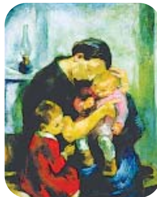
Szőnyi István: Anya

hazamehessenek, és ezt a napot az édesanyjukkal tölthessék. Előtte elkészítették az anyák ünnepi süteményét.